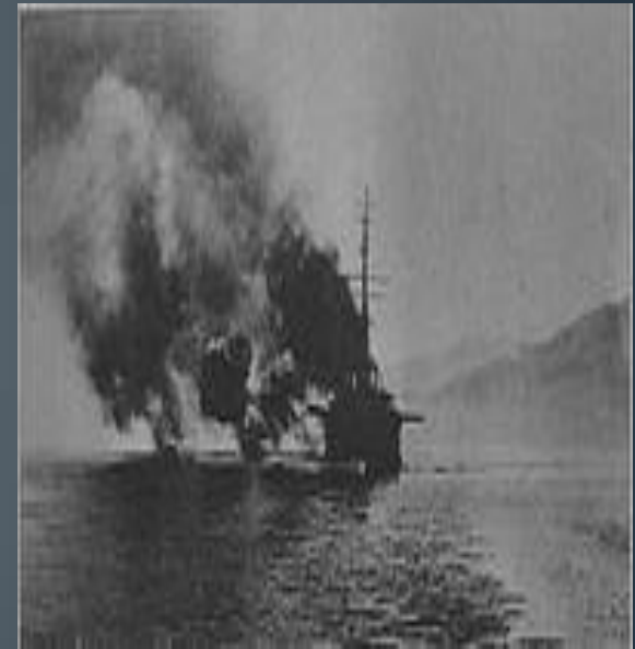
Γαλλικό πλοίο βομβαρδίζει την Αθήνα, το 1916

Όλα τα λιμάνια ήταν αποκλεισμένα από τους Γάλλους, με αποτέλεσμα η Αθήνα αλλά και άλλες πόλεις της Νοτίου Ελλάδος να λιμοκτονήσουν.