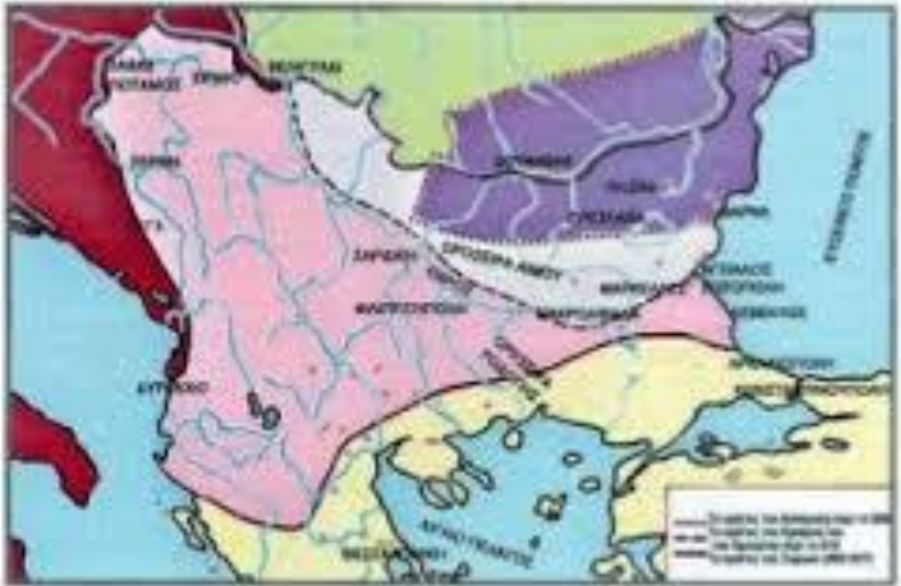
ΤΟ ΠΡΩΤΟ ΒΟΥΛΓΑΡΙΚΟ ΚΡΑΤΟΣ ΕΝΤΕΥΘΕΝ ΤΟΥ ΔΟΥΝΑΒΗ